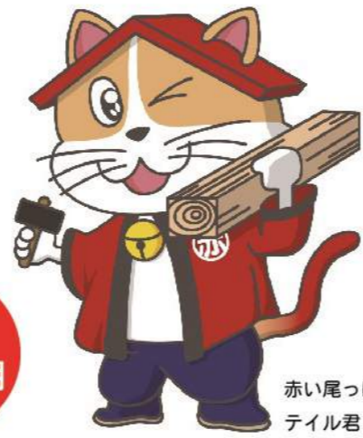
赤い尾っぽの テイル君