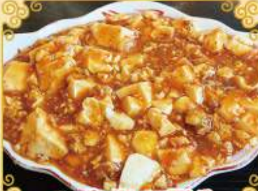
マーポードウフ 750円