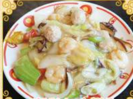
エビ五目カニソバ 898円